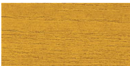
6570 eiche hell