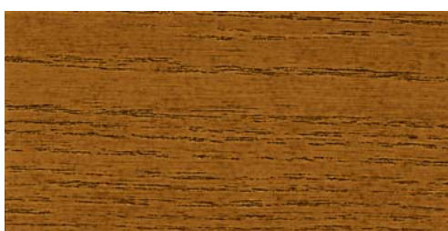
8260 eiche antik